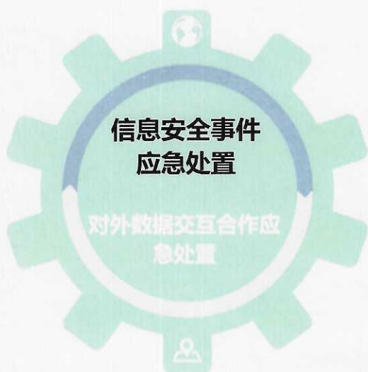
图 6：华安合鑫数据安全事件（事故）应急处理预案

为了切实贯彻落实安全保卫工作预防为主的原则，健全和完善各项防范应急措施，提高广大员工的防范技能和有效处置突发事件的能力，华安合鑫制定《数据安全管理及应急管理制度》。其中明确了数据安全突发事件的管理机制、职责分工以及相应的突发事件应对程序，确保华安合鑫数据安全突发事件发生时，相应工作有据可依，相关应对工作有序开展，突发事件得到及时应对。